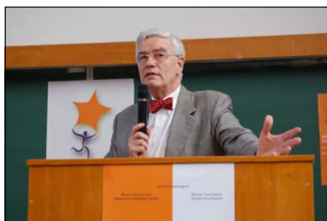
L'ambassadeur Hervé Bolot.